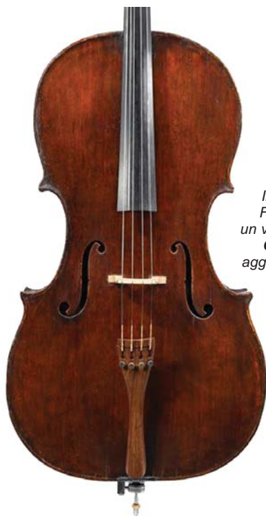
Il top lot di Freemans: un violoncello G. Tononi aggiudicato a €192.500