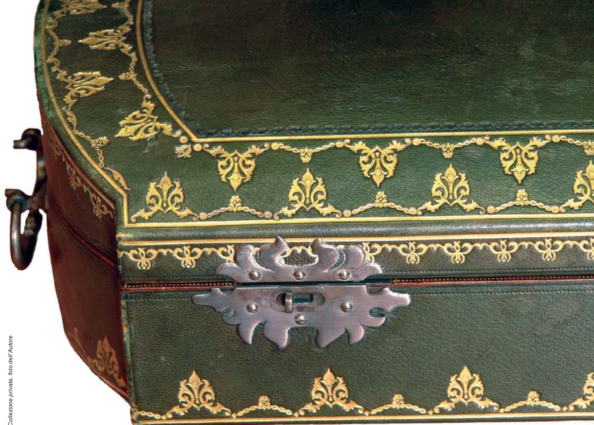
Dettaglio di un magnifico esemplare della produzione ottocentesca di Hill fin de siècle. È rivestita esternamente in pelle e foglia d'oro come quelle di due secoli prima e non vi è alcuna concessione all'economia di costruzione

custodie per trasportare strumenti, esattamente come chi ha in garage un'Avions Voisin del 1936 non la guida tutti i giorni per andare in ufficio.